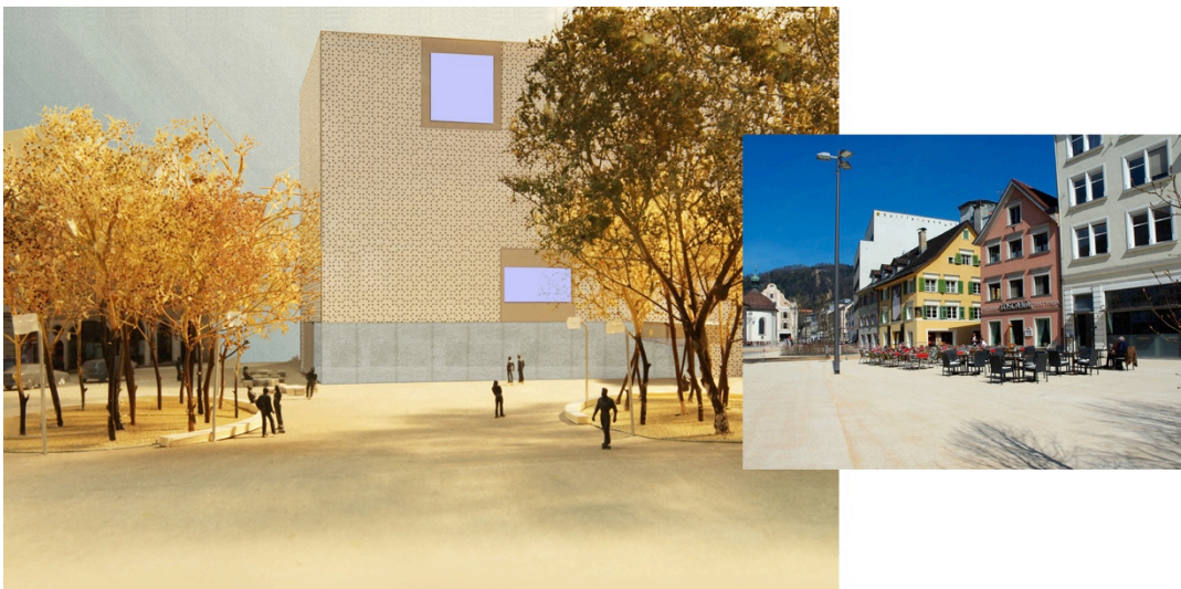
Links: Modellfoto / © VOGT, kleineres Bild: © Curt Huber.

Vor dem Vorarlberg Museum, der Raiffeisenbank und dem Gasthaus Kornmesser bzw. der Nepomukapelle wurden insgesamt drei Bühnen aufgebaut. Um 18 Uhr gibt es zunächst einen offiziellen Festakt mit Ansprachen, dann beginnt das bunte Rahmenprogramm, das bis in die Nacht dauert. Mit verschiedenen Angeboten dabei sind auch die Geschäfte am Kornmarkt, während die angrenzenden Gastronomiebetriebe für das leibliche Wohl der Gäste sorgen und diese mit kulinarischen Köstlichkeiten verwöhnen. Am Samstag, 11. Mai 2013, geht das Programm dann ab 10 Uhr weiter und dauert bis zum Abend.